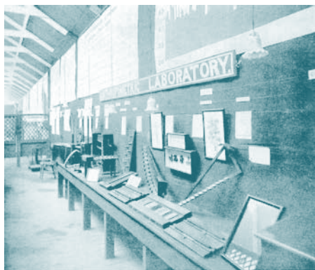
Figura 4. Laboratorio de Antropometría de Francis Galton.

Resulta notable, en los trabajos empíricos de Galton, su interés por la precisión de sus datos, considerando que él mismo fue pionero en el uso de distintos métodos estadísticos para estudiar diferentes variables asociadas a las capacidades del hombre, tanto físicas como mentales. En su obra más importante, Hereditary Genius (1869) (Ver figura 4), Galton describe una serie de procedimientos estadísticos para dar sustento a su teoría de la heredabilidad de las habilidades naturales del hombre. Para ello, consideró distintas variables que le permitieran cuantificar esos "dones" naturales del hombre, entre esas variables tuvo en cuenta el nivel de reputación como indicador de buenas habilidades de carácter heredable. Por esta razón, Galton usó una muestra de distintos grupos sociales, entre los que se encontraban jueces, estudiantes y profesionales de otras áreas.