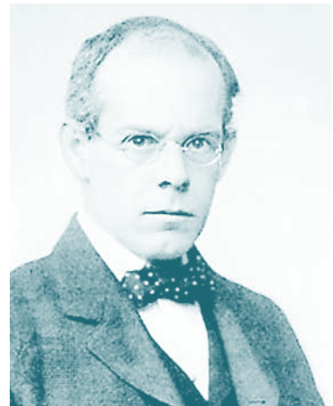
Figura 3. James Mackeen Cattell (1860-1940).