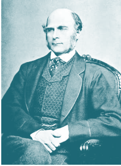
Figura 1. Francis Galton (1822-1909).