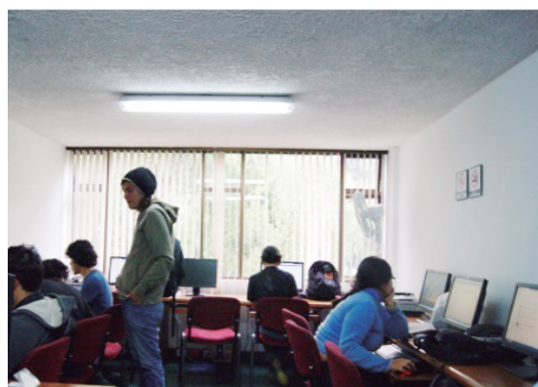
Sala de cómputo para estudiantes – Carrera de Historia

La sala de cómputo del Departamento de Historia ofrece a sus estudiantes servicio de internet, impresión y escáner como herramienta complementaria para la realización de sus actividades académicas. Posee 11 equipos de cómputo, 3 escáneres e impresora láser.