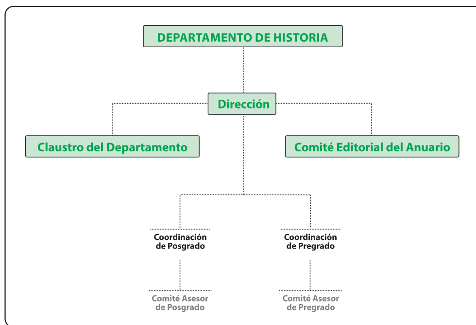
Figura 2. Organigrama