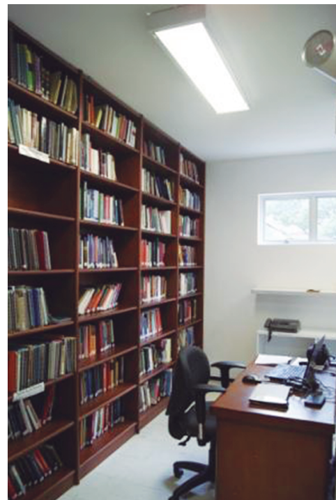
Centro de Documentación Jaime Jaramillo Uribe