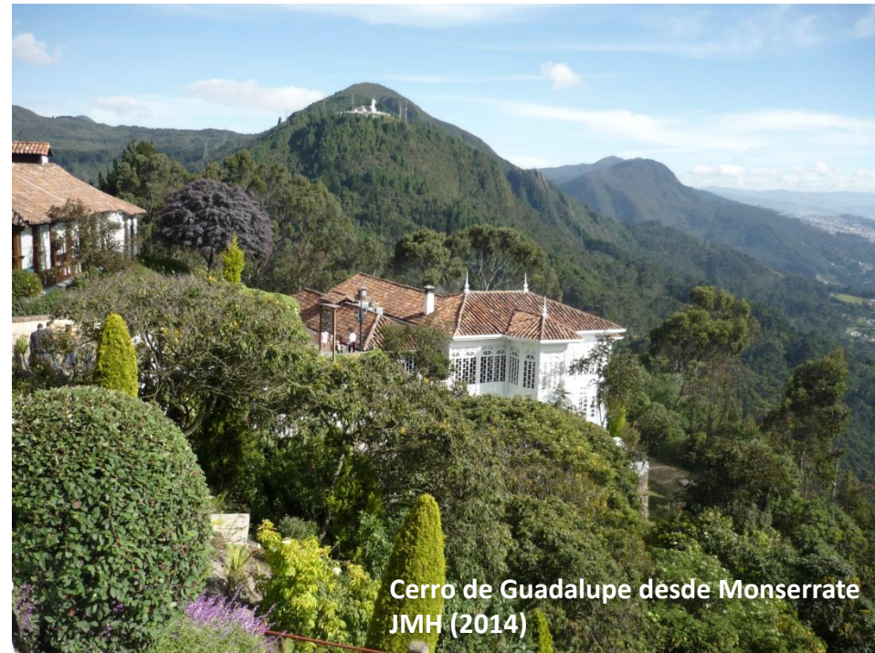
Cerro de Guadalupe desde Monserrate JMH (2014)