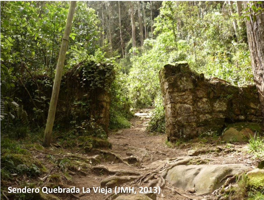
Sendero Quebrada La Vieja (JMH, 2013)