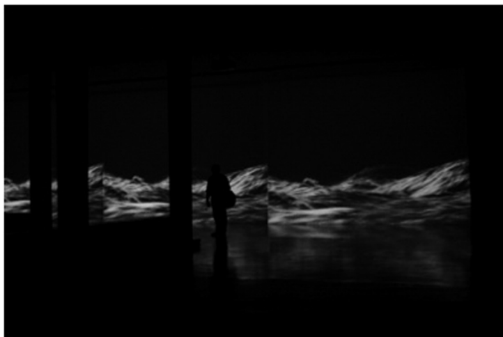
Treno [canto fúnebre] (2007-2009).