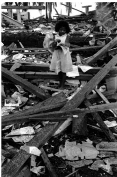
La letra con sangre (2009).