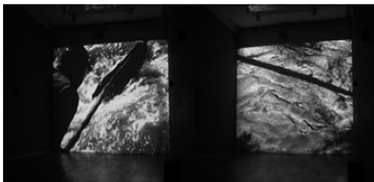
Treno [canto fúnebre] (2007-2009)