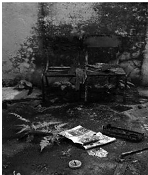
La letra con sangre (2009).

Las geografías del terror (Oslender, 2003) son visibles a través de los lugares abandonados, bombardeados y saqueados, donde, por ejemplo, pueblos enteros han sido dejados después de ataques o enfrentamientos entre guerrilla, paramilitares y militares, o donde sucedieron masacres y la gente salió desplazada; al mismo tiempo que otros pueblos siguen siendo habitados en medio