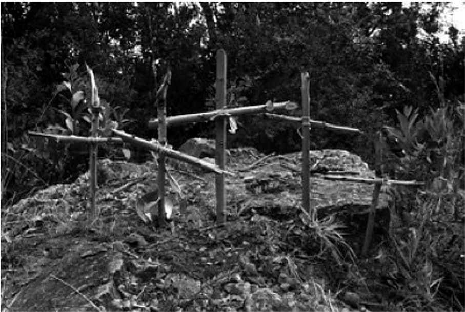
Campo Santo (2006).