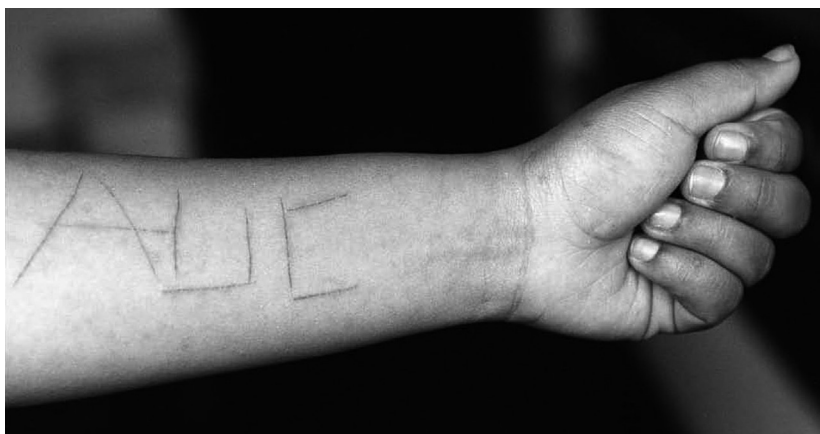
Una joven líder, estudiante de bachillerato, fue violada por cuatro integrantes de grupos paramilitares. La mujer fue además quemada con un cigarrillo y marcada en su brazo.

sucedido y lograr estar presentes en éste para captar “todo”, para que no se les escape ningún detalle; por ejemplo, los reporteros de guerra tienen que estar en “el momento” del acontecimiento documentando los hechos lo más cerca y presencialmente que sea posible. En cambio, las imágenes de Abad Colorado están cargadas de tiempo, huellas y ausencias al permitir la evocación de lo que implica vivir en medio de esas ruinas, y de cómo esos actos violentos son incorporados en la cotidianidad de las personas.